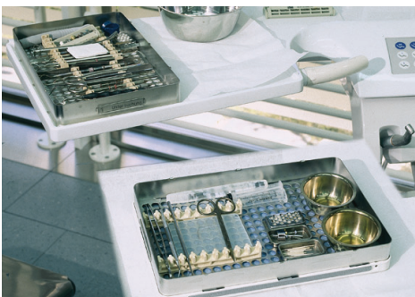
Vapocid® Trays der KAB.

An weiteren Posten werden Platzvorbereitung, Patientenwechsel, Labor und Trays behandelt. Die Vapocid® Trays, welche in der KAB benutzt und von dieser mitentwickelt wurden, sind aus Chromstahl, ent-